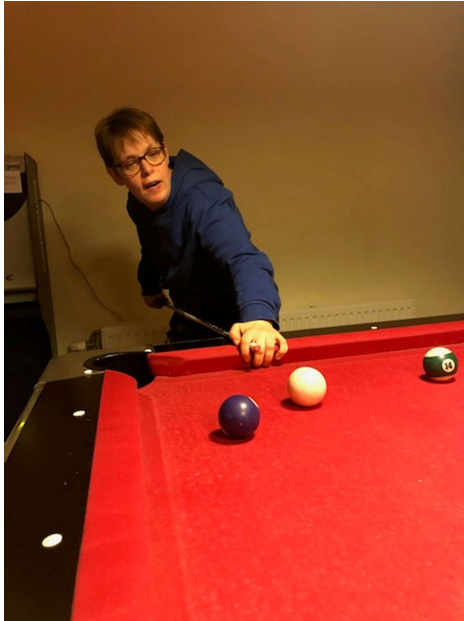
welke moet ik nou nemen?