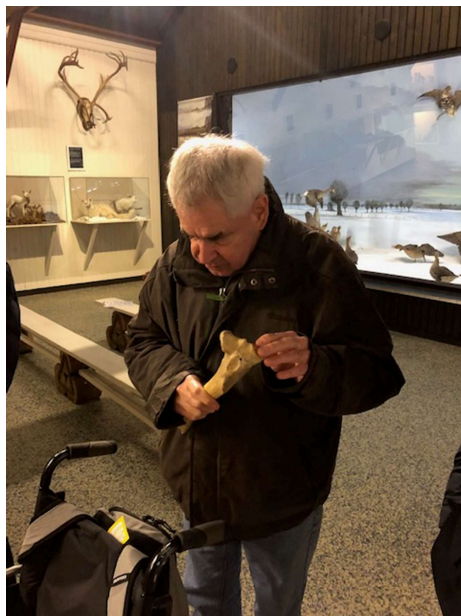
welk bot heb ik nu vast?