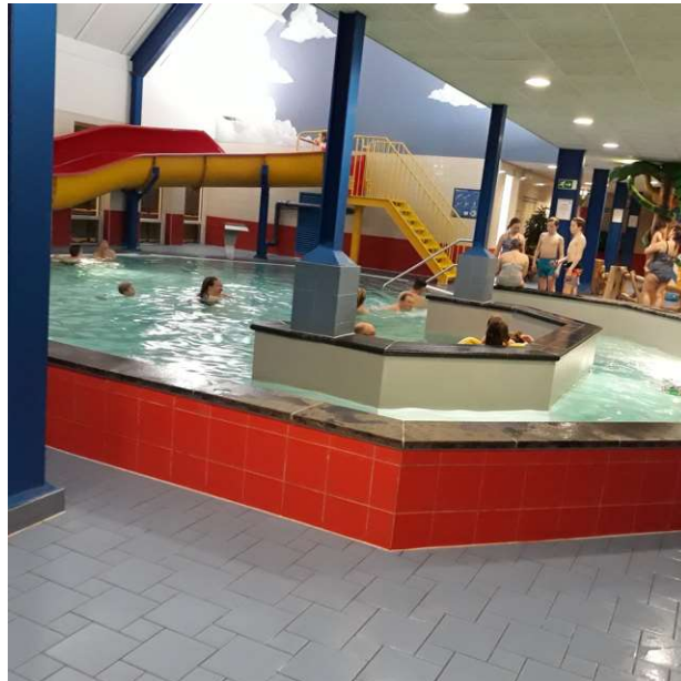
heerlijk bubbelen in het zwembad

We kijken naar The Sound of Music en gaan rond half zeven eten in het restaurant op het park. Iedereen mag kiezen wat hij wil eten, sate, vis, biefstuk en veel frites, het smaakt allemaal heerlijk! Ook krijgen we alweer een rondje van Ien, wat een verwennerij! Niemand maakt het laat vanavond, we zijn allemaal nog een beetje moe van oudjaarsavond dus maar lekker vroeg naar bed.