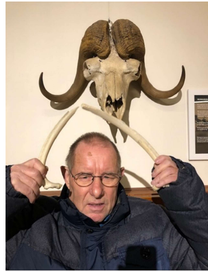
De Huomo dirigentus