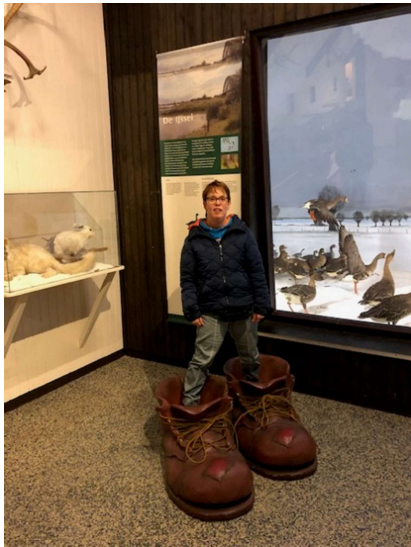
wel erg grote mensen daar