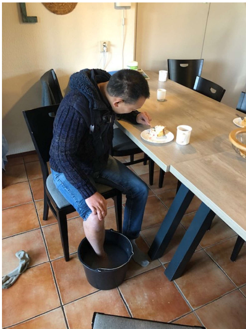
behandeling van een ontstoken teen en gebak