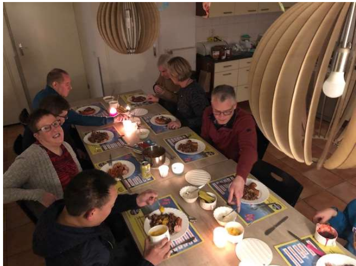
gezelligheid kent geen tijd

We overleggen met elkaar wat we vandaag gaan doen en besluiten naar Deventer te gaan. Het is koud en we hebben best trek in lekkere warme vis, kibbeling en haring.