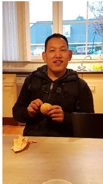
nog ff nagenieten