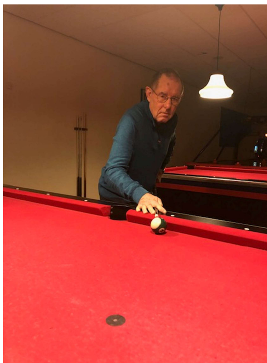
via de band