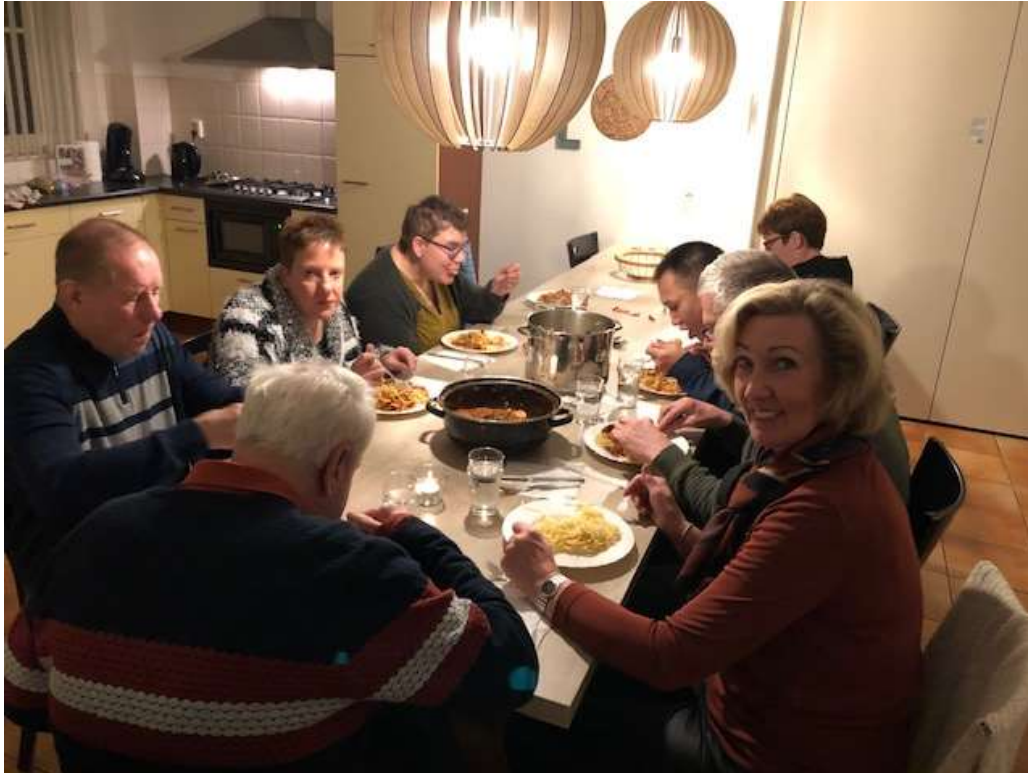
om te beginnen de spaghetti.