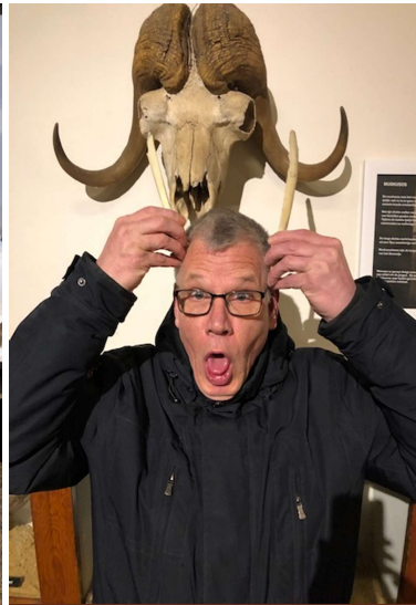
welke soort is dit?