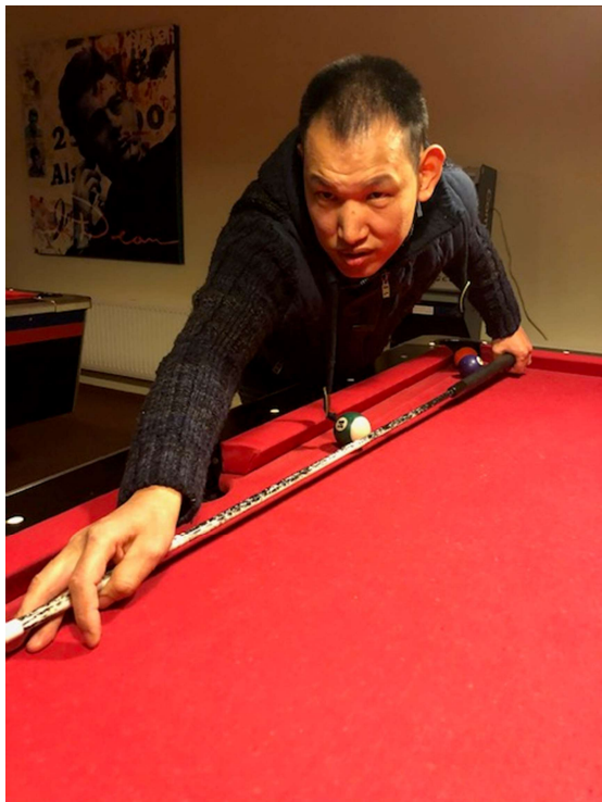
een volleerde trekstoot

Het wordt al snel duidelijk dat niemand echt zin heeft om erop uit te gaan. Een aantal gaat een wandeling maken, even naar de speelhal en twee willen zwemmen.